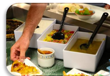
Cafétéria sur place

Le CIEL Bretagne se réserve le droit de réduire le volume horaire en cas d'un nombre insuffisant de stagiaires dans un groupe.